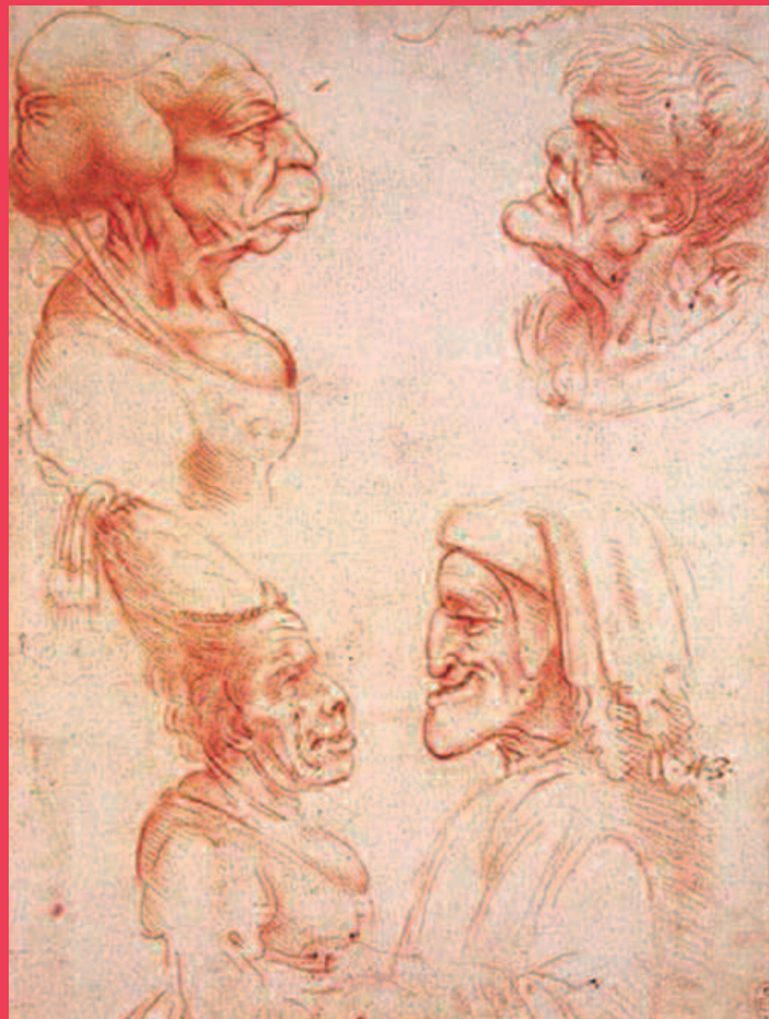
Leonardo da Vinci, Cabezas grotescas , c. 1490

Se utiliza sobre todo en los retratos en los que, con sentido del humor, se exageran los rasgos distintivos de la persona: tanto los buenos como los no tan buenos.