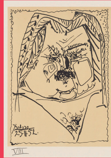
Pablo Picasso, Balzac. VIII , 1952