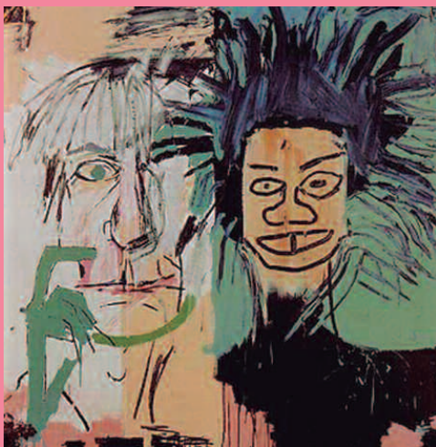
Jean-Michel Basquiat Dos cabezas 1982