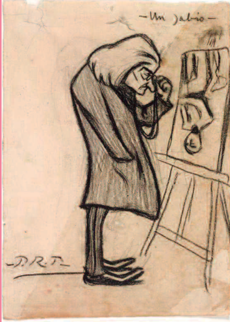
Pablo Picasso, Un sabio , 1899-1900. En aquellos momentos, los especialistas en pintura no entendían nada de lo que hacían los artistas contemporáneos.

Y otras para satirizar en un tono más crítico sobre temas que le preocupaban: