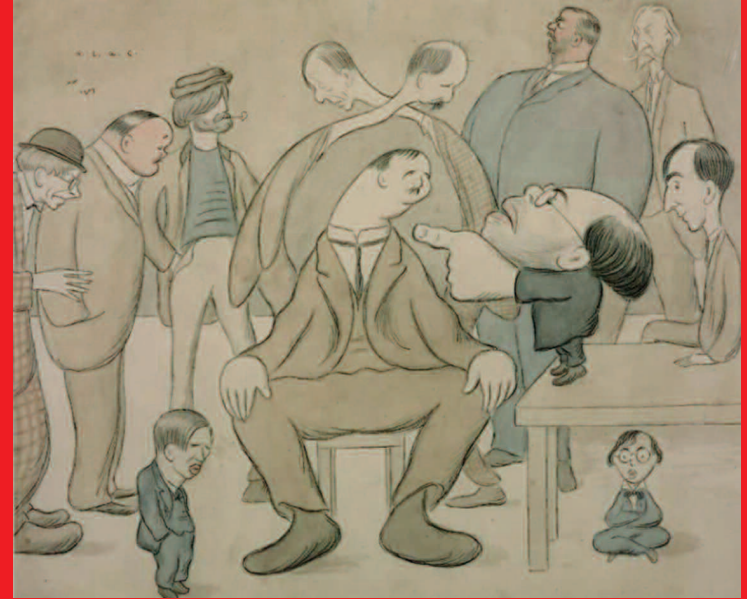
Henry Maximilian «Max» Beerbohm, El Nuevo Club de Arte Inglés , 1907