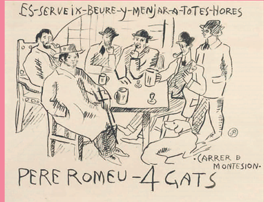
Pablo Picasso, Pere Romeu - 4 Gats, 1902

El joven Picasso quería ser uno de ellos y por ello se unió a su práctica de crear caricaturas.