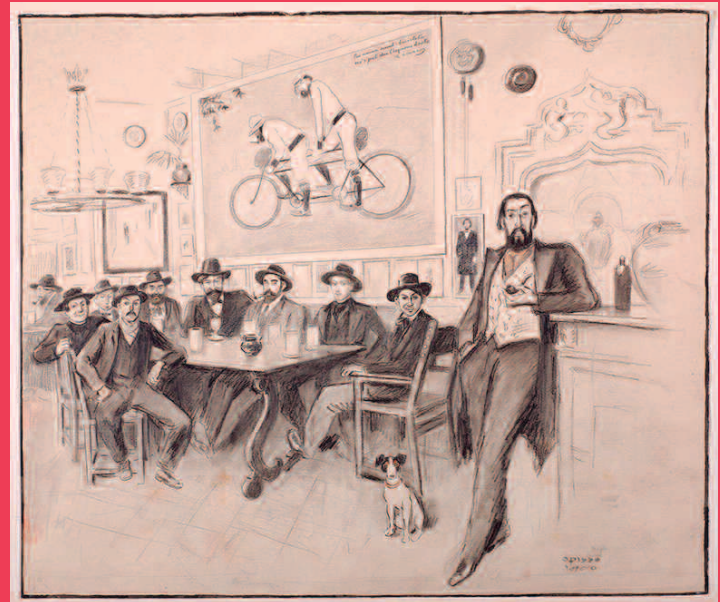
Ricard Opisso, Interior de la taberna Els Quatre Gats , 1900

En ese momento también gozaban de gran popularidad las revistas humorísticas, que se ilustraban con caricaturas de personajes y situaciones políticas o de actualidad.