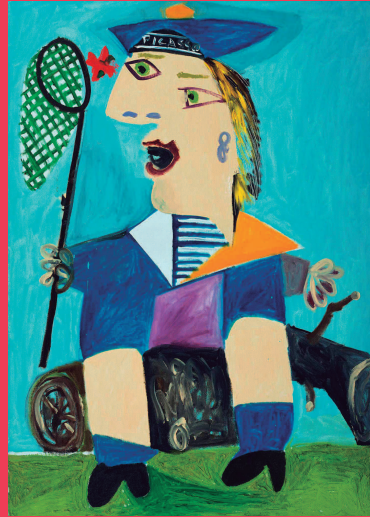
Pablo Picasso, Maya vestida de marinera , 1938