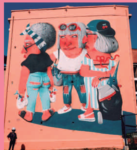
Marina Capdevila Marujas 2017