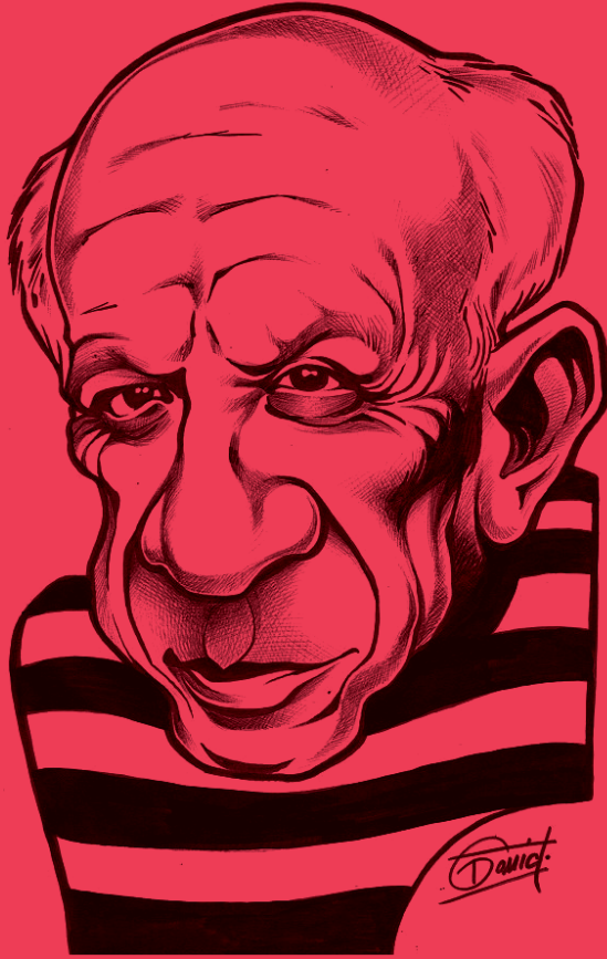
Año y autor desconocidos

De hecho, como mejor funciona la caricatura es practicándola en un contexto cultural compartido: hay que saber identificar a la persona caricaturada y valorar el equilibrio entre lo verídico y lo falso en la caracterización. .