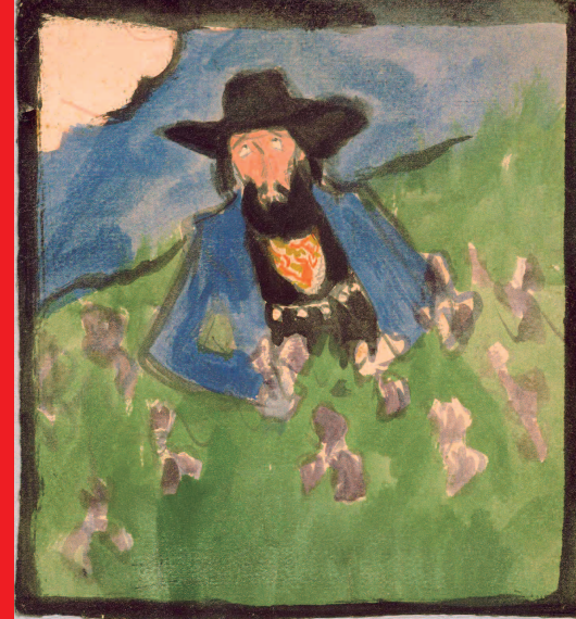
Pablo Picasso, Pere Romeu en un campo de lirios , 1900. Romeu, propietario de la taberna Els Quatre Gats, era un soñador bastante inocente, siempre «iba con un lirio en la mano».