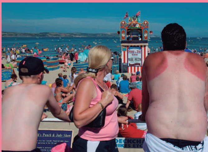
Martin Parr Think of England 2000