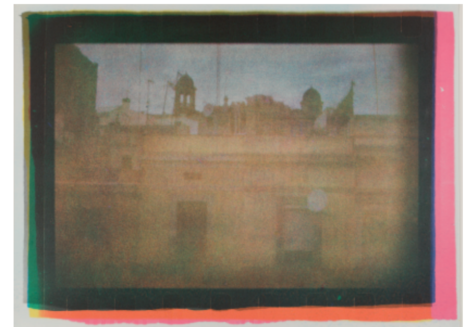
Bernard Plossu Barcelona, 2019 Fotografia revelada amb la tècnica Fresson