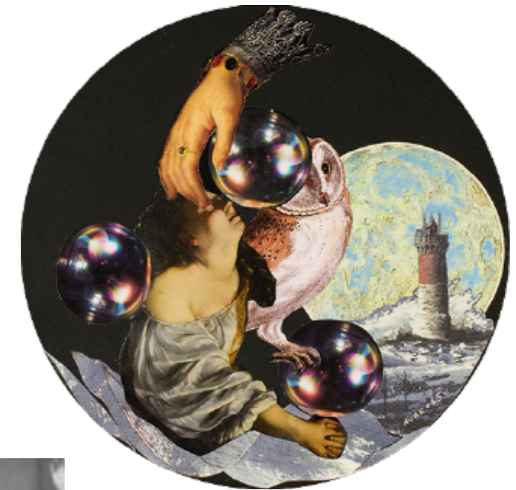
Aube Breton-Elléouët L'attente (L'espera) , 2000 Laleh June Gallery

El seu recorregut artístic és extens i destaquen les seves composicions de collage plenes de lirisme, realitzades a partir del 1970. Les seves obres s'han pogut veure en multitud d'exposicions, tant individuals com col·lectives, a què ara s'hi suma el Museu Picasso, que exposarà per primera vegada a Catalunya nombrosos collages de l'artista en el marc de la Primavera Surrealista.