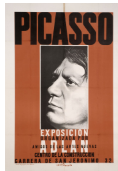
Cartell de l'exposició «Picasso» a Madrid, 1936 Archives du Musée National Picasso, París