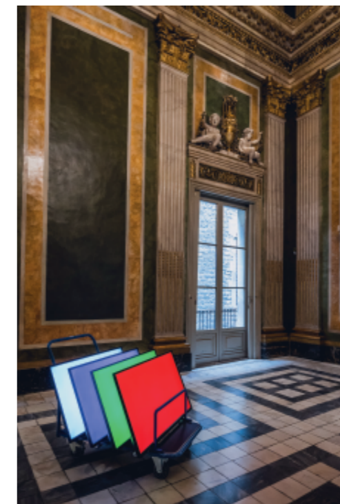
LOOP festival: Tao Hui. 'Screen as Display Body' Un projecte de Museu Picasso de Barcelona & LOOP Del 14 al 24 de novembre de 2023 Museu Picasso Barcelona Agraïments: Stavros Efremidis Collection & Esther Schipper

A més, continuarem amb el compromís de programar fent ciutat, participant, com ja hem fet en edicions anteriors, en esdeveniments com el Barcelona Dibuixa , la Nit dels Museus o els més recents In Museu , el Barcelona Obertura , Museus i Creació i En Residència 2024 - 2025 .