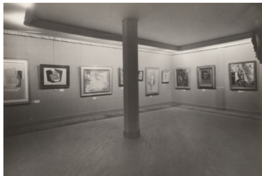
Exposició «Picasso» a la Sala Esteva Barcelona, 1936