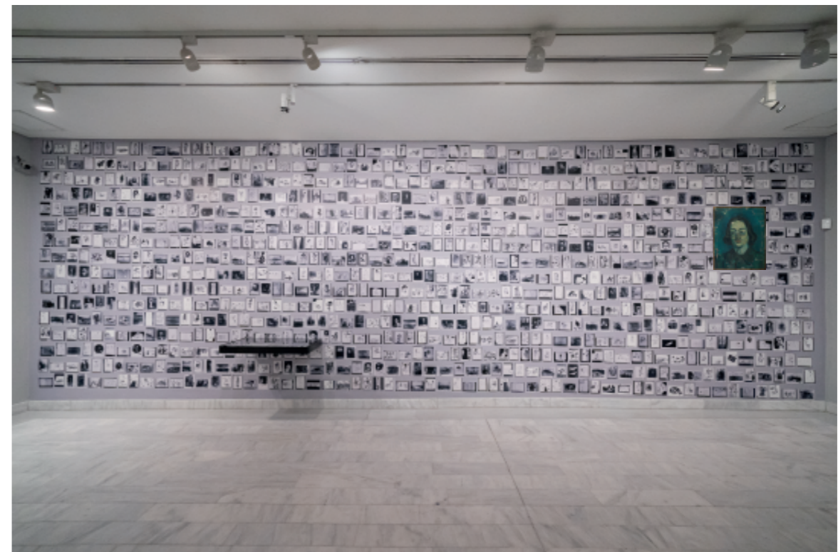
Sala amb fotografies de Melich amb les obres de Picasso de la donació de 1970