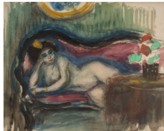
Ricard Canals Llambí