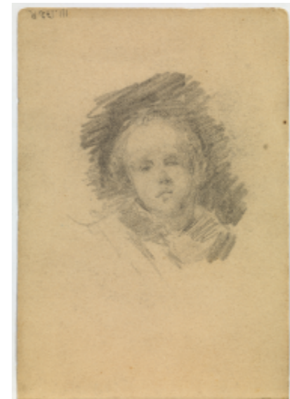
Pablo Picasso Còpia de El Niño de Vallecas de Velázquez Madrid, 16 d'abril del 1895 Llapis grafit sobre paper Àlbum de Madrid, Màlaga i Barcelona, 1895-1896 Madrid, Màlaga i Barcelona, 1895-1896