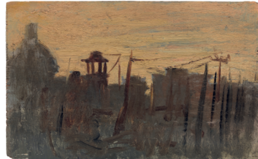
Pablo Picasso Terrats de Barcelona Barcelona, 1896 Museu Picasso, Barcelona