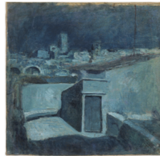
Pablo Picasso Terrats de Barcelona Barcelona, 1902 Museu Picasso, Barcelona ©Successió Pablo Picasso, VEGAP, 2024