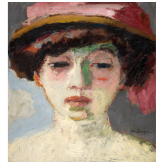
Kees Van Dongen