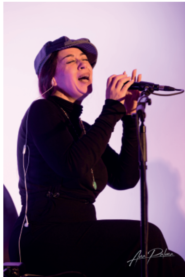
Espectacle Recordant Marchena al Museu Picasso (19.01.2024)

Un d'aquests encreuaments és el que hem posat en marxa amb El Dorado. Societat Flamenca barcelonesa, que programarà una actuació mensual de flamenc. Aquesta col·laboració vol portar més enllà l'exposició temporal Miró-Picasso , germen del projecte, i proposa explorar la relació de Picasso amb el flamenc, tot convidant els artistes a dialogar i a interpel·lar, des de la contemporaneïtat, i dins el Museu, el patrimoni picassià. Aquest és un programa que vol sumar-se al ric teixit cultural flamenc barceloní per tal de dotar-lo de nous matisos i perspectives en diàleg amb l'obra de Pablo Picasso.