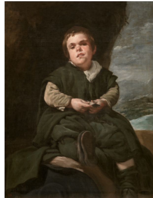
Velázquez El niño de Vallecas , 1635-1645 Museo del Prado

I enguany tindrem uns convidats d'honor que ens ajudaran a entendre l'ull de Picasso. Es tracta d'un intercanvi d'obres amb el Museo del Prado que permetrà incloure un diàleg entre obres dels grans mestres del segle d'or espanyol i obres de Picasso que es presentarà durant el mes