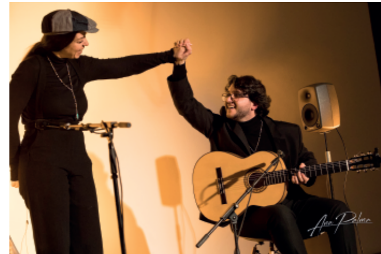
Espectacle Recordant Marchena al Museu Picasso (19.01.2024)

Compartint el desig de treball en xarxa amb el festival de videocreació LOOP Barcelona, hem establert una aliança que vol depassar la relació puntual durant el festival. Donarem suport a projectes que investiguen temes que ens són